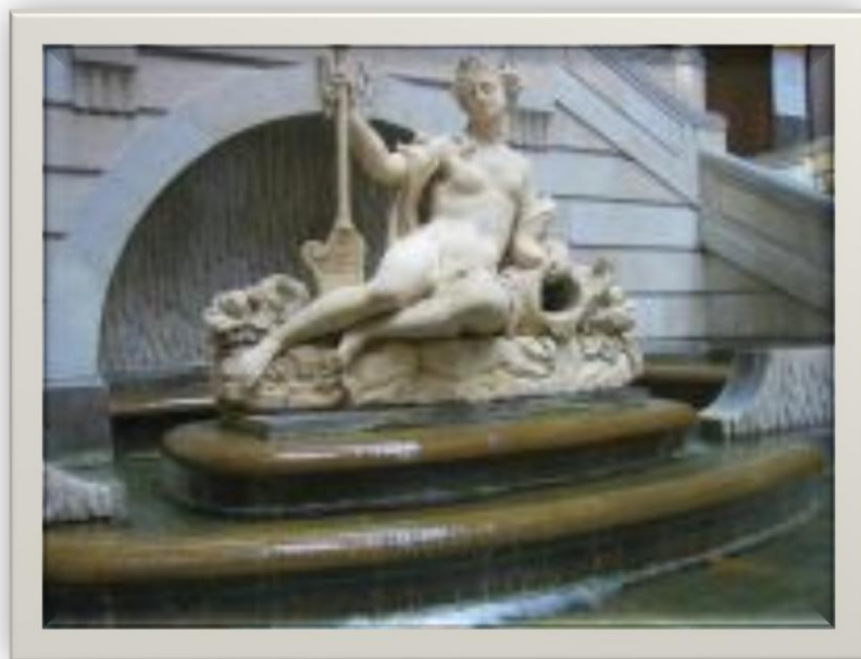
Rzeźba Amfitryty w Montrealu

I tak właśnie królową wód została Amfitryta.